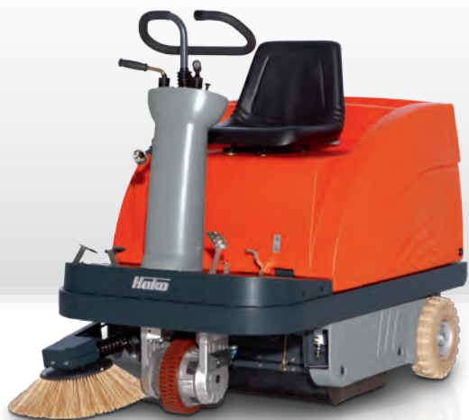
Sweepmaster B900 R