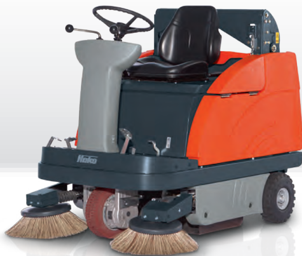
Sweepmaster B980 RH