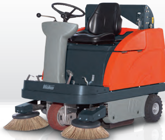
Sweepmaster B980 RH